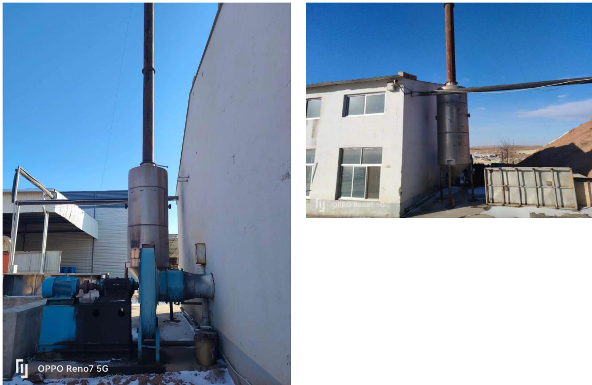
布袋除尘器及锅炉排气筒

本项目配套 1 台 4t/h 生物质蒸汽锅炉，锅炉烟气中主要大气污染物为烟尘、SO 2 、NO x 。锅炉烟气经布袋除尘器处理后由 15m 高的烟囱排放，