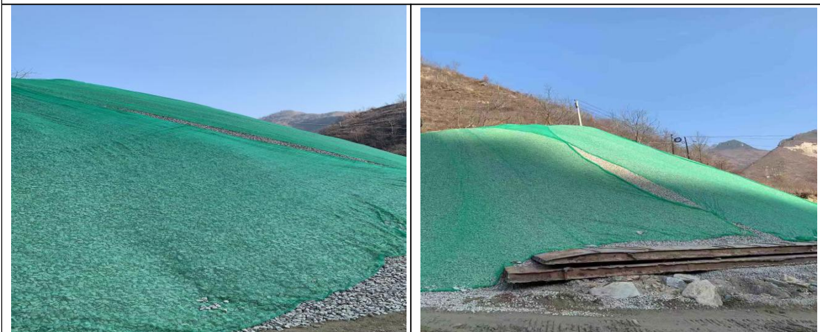
堆场采用防尘网覆盖